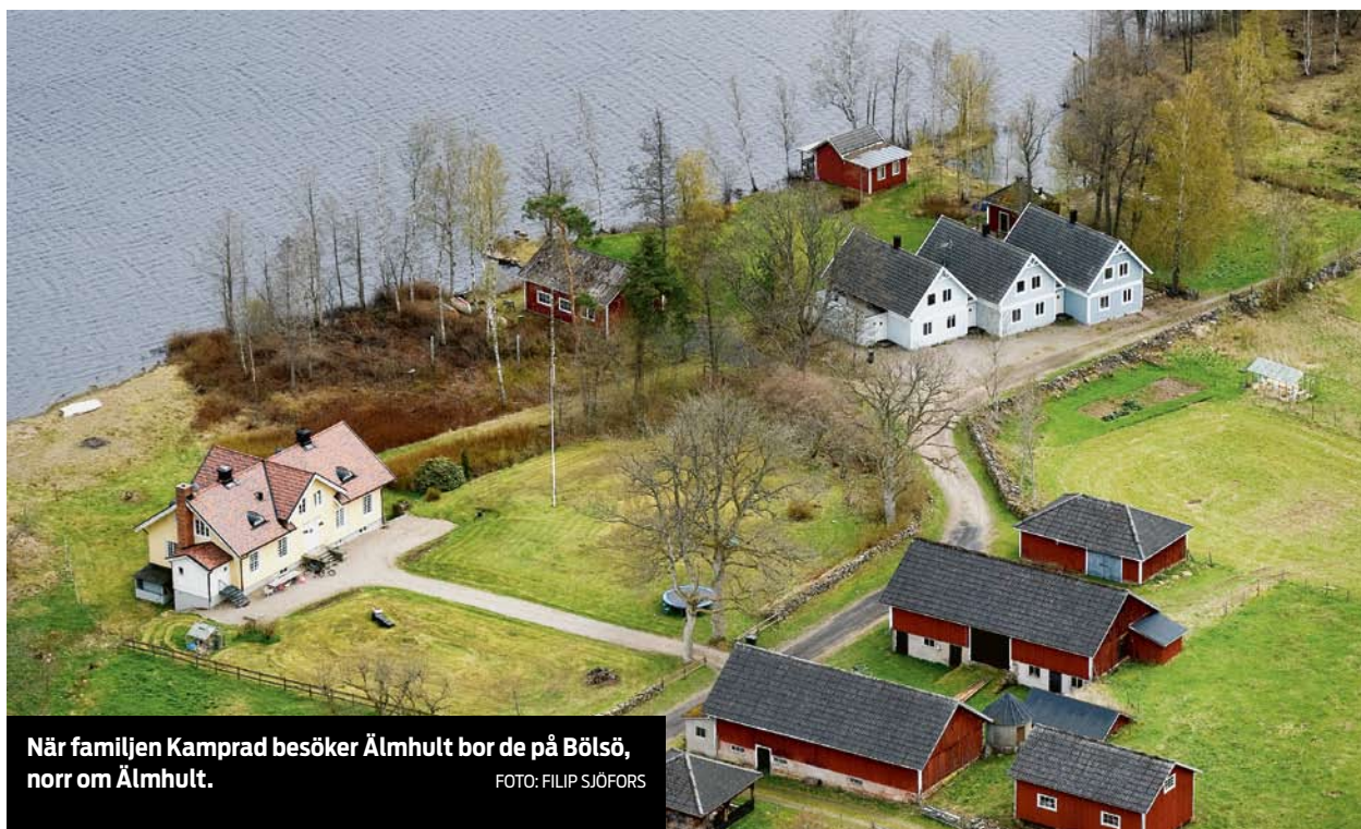
När familjen Kamprad besöker Älmhult bor de på Bölsö, norr om Älmhult.

TEXT: BOSSE VIKINGSON bosse.vikingson@smp.se 0470-770 657